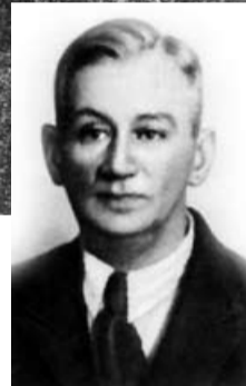
Арсений Митропольский (Несмелов)

Рассказывают, что, когда советские войска заняли Харбин, поэт знал, что имя его – в списке опаснейших врагов. Митропольский ждал ареста. Надел форму, написал записку. Налил в рюмку водки и поставил на стол, прямо на эту записку. Когда пришли его забирать, он сдал оружие со словами: «Советскому офицеру от русского офицера». Указал взглядом на записку. Поднял рюмку и выпил. В записке было: «Расстреляйте меня на рассвете». Советский офицер, прочитав, ответил: «Расстрелять на рассвете не обещаю, но о вашем желании доложу обязательно»... Подробности гибели поэта неизвестны.