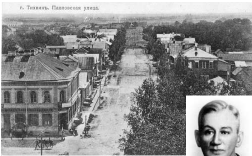
г. Тихвин. Павловская улица.

Герой одного из рассказов Несмелова думает во сне: «Как будто это мой Тихвин». Сказано это слишком сильно для просто гостя города. Возможно, что бабушка